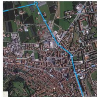
SALUZZO - dettagli partenza