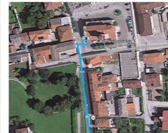
ENVIE - dettagli arrivo