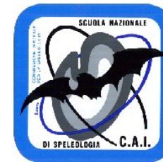
SCUOLA NAZIONALE DI SPELEOLOGIA