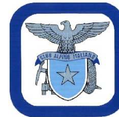
CLUB ALPINO ITALIANO sez. di Palermo

N.B.: Le lezioni avranno inizio alle ore 18,00 dei giorni stabiliti, nei locali della sede del C.A.I. di Palermo, gli orari di partenza per le esercitazioni pratiche verranno stabiliti di volta in volta dalla Direzione del Corso. La stessa si riserva di apportare modifiche al programma qualora ne ravvisi la necessità.