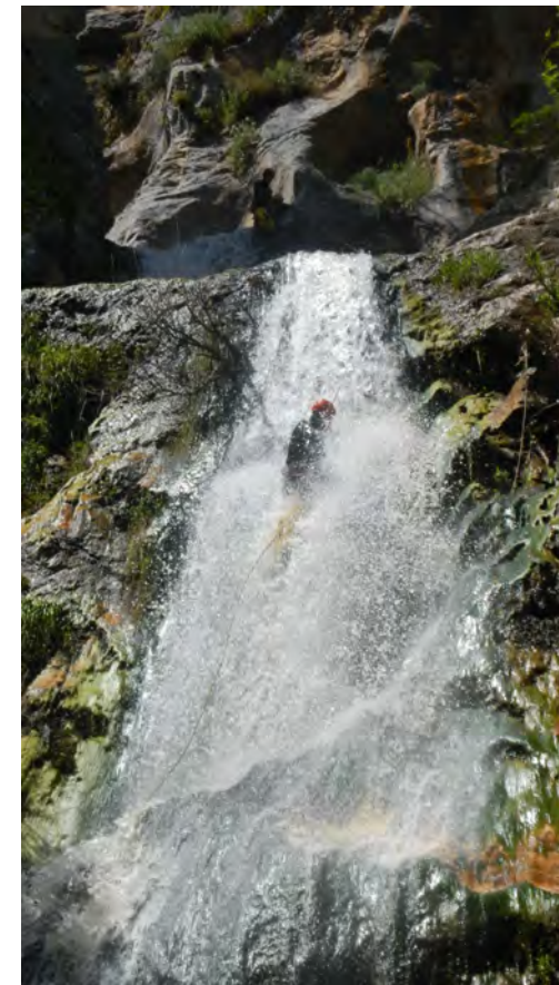
Sopra: Gole Ranciara– Antillo (ME)

Le lezioni in aula si terranno al rientro dalle esercitazioni .