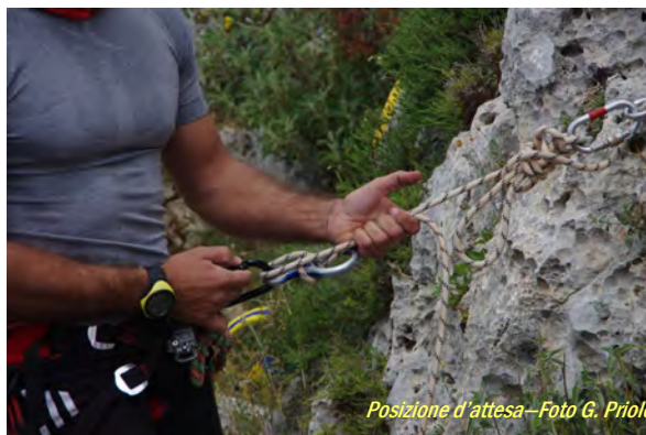
Posizione d'attesa